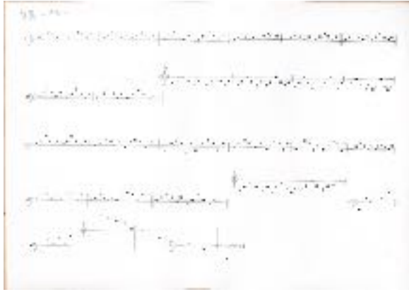
【白鳥 旋律の図形楽譜（ピアノ）】