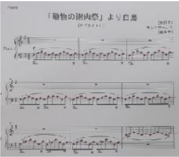
【白鳥 旋律楽譜 (ピアノ)】