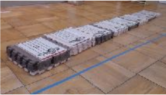
【階段状の旋律のジョイントマット】